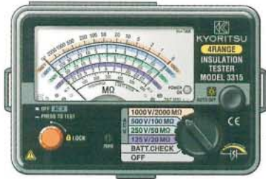
3315 125V/250V 500V/1000V