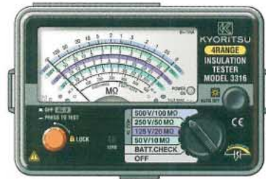
3316 50V/125V 250V/500V