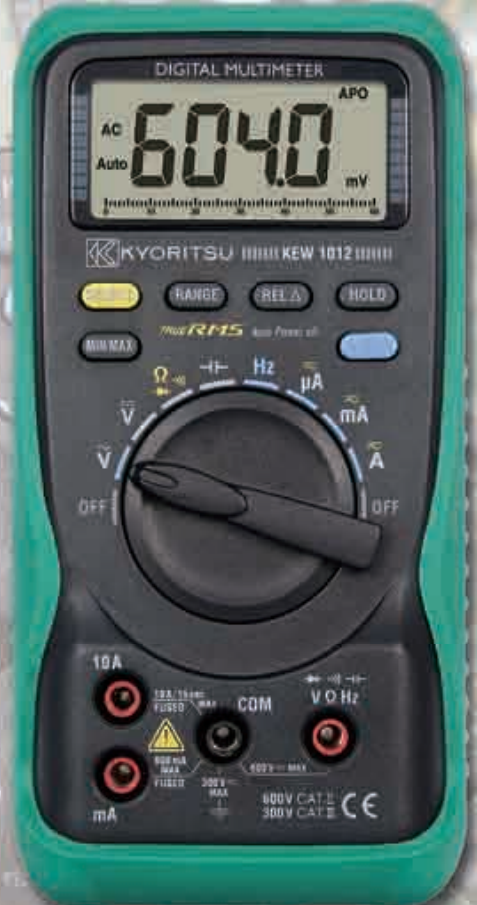
KEW 1012 真の実効値タイプ 標準価格 11,000円(税込 11,550円)