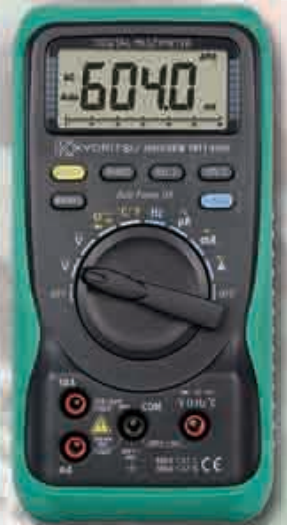
KEW 1011 平均値タイプ 温度測定機能(温度プローブ付属) 標準価格 9,000円(税込 9,450円)